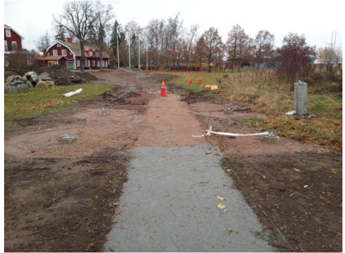
Byggstart september 2013