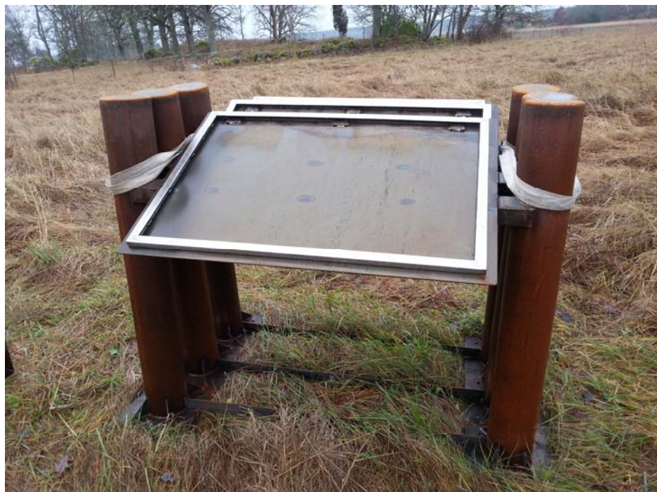
Tre låga informations-tavlor

Berättartavlorna beskriver platsens betydelse för riksbildningen, slaget vid Herrevadsbro och en beskrivning av vardagen i Kolbäck under 1200-talet. Texterna översattes till engelska och finns på en internetsida. Språkversionen öppnas i en smartphone med den QR-kod, som finns på berättartavlorna. Mycket arbete lades ned på att leta underlag till en beskrivande karta över landskapet vid 1200-talet. Även ett högupplöst fotografi på den minnestavla i Kolbäckskyrka, som beskriver slaget, fordrades för att komplettera texterna. Samtidigt informerades illustratören om textinnehållet på skyltarna och arbetsgruppens förslag till lämpliga illustrationer, med anknytning till berättelserna. Efter ett antal korrektursväningar mellan estetgruppen och illustratören var alla nöjda med resultatet.