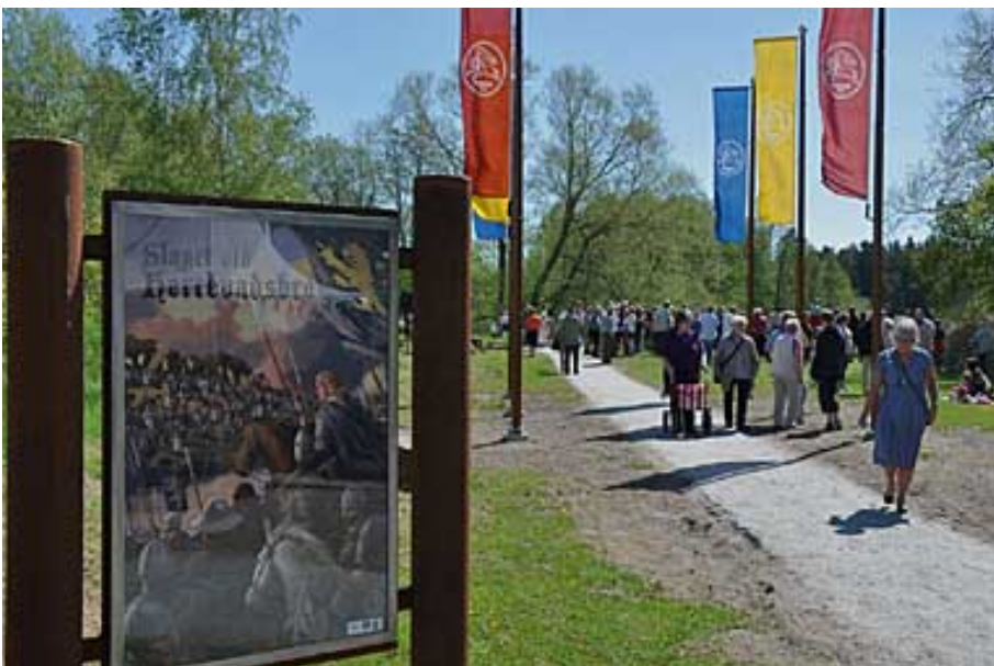
En välbesökt invigning med besökare från när och fjärran.

I Västmanlands Läns Museum planerade utställning i Västerås, kommer slaget vid Herrevadsbro att presenteras, som en viktig händelse för bildandet av riket Sverige, med en koppling till minnesplatsen.