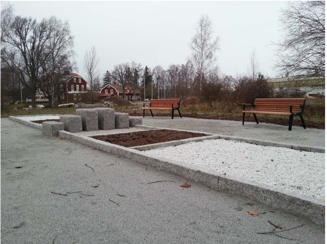
Minnesplatsen november 2013