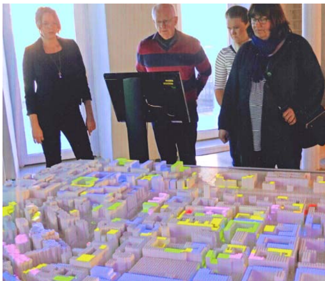
Studiebesök hos Visualiseringscentrum i Norrköping