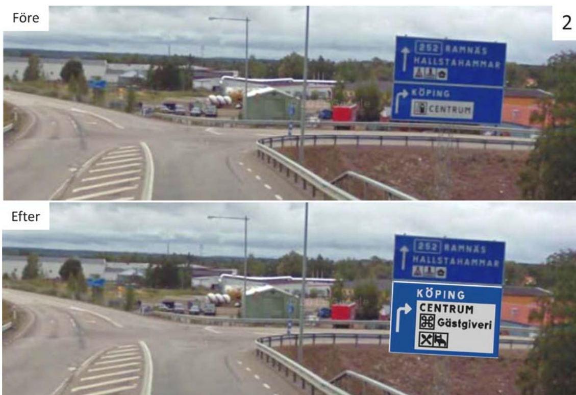
Exempel på föreslagen skyltning